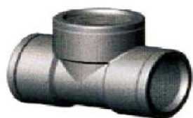
(630) Тройник. Внутренняя резьба