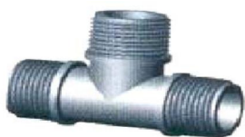
(605) Тройник с наружной резьбой