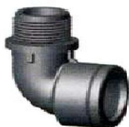
(627) Угольник. ВР×НР